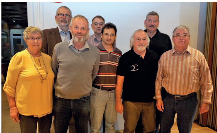
TV-Vorstandschaft 2018 (VI):