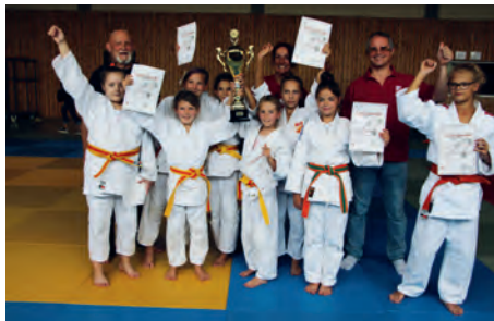
Bayerische Vizemeisterinnen der KG Altdorf/Altenfurt

Bei den Bayerischen Mannschaftsmeisterschaften der U12 in Altenfurt durften dann endlich auch die Mädchen zeigen, dass sie kämpfen können. Es waren zwar nur 4 Mannschaften qualifiziert und leider trat wieder eine davon nicht an, aber immerhin – es gab Gegnerinnen,