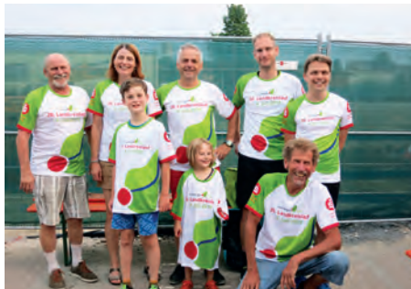
Gruppenbild mit den Landkreislauf T-Shirts beim Sommerfest

zu kurz. Dabei wurde das Getränk vom Lauffreff gestellt und das Grillgut hat jeder selbst mitgebracht. Zum Sommerfest konnte neben der Unterhaltung und dem süßen Nachtsch auch die fertig gedruckten Landkreislauf T-Shirts mit Vornamensaufdruck der teilnehmenden Läufer und Walker verteilt werden. Diese haben dann auch zu dem unten gezeigten Gruppenbild animiert.