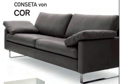
CONSETA von COR