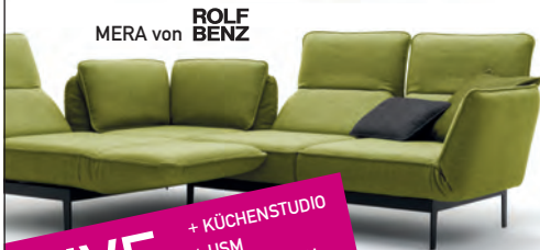
MERA von ROLF BENZ