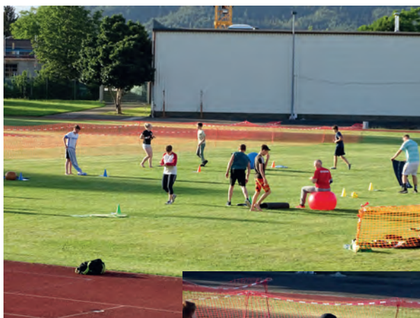
Outdoor-Training im letzten Jahr