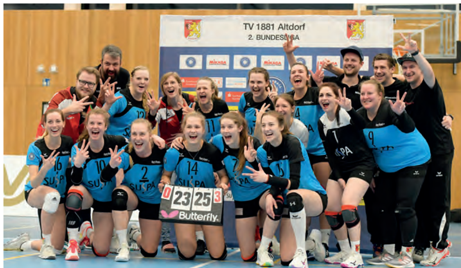
Beigeisterung nach dem Sieg gegen Planegg-Krailling

Der Klassenerhalt wurde aus eigener Kraft erreicht, die zwei letzten Spiele des TV Altdorf wurden wegen der Pandemie nicht mehr gespielt (auch Altdorf hatte einen positiven Fall), eine noch bessere Platzierung bis Platz 7 wäre also durchaus möglich gewesen. Eine tolle Leistung unsere Damen I und des Trainerstabs.