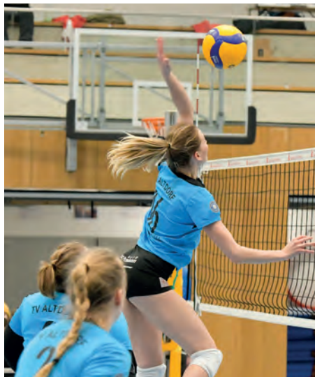
Bilder aus der abgelaufenen Saison.

Die zweite Garnitur, die Damen II , spielt weiterhin in der Bayernliga , die Damen III in der Kreisliga , während die Herren wieder eine Spielgemeinschaft mit Neunkirchen ( Bezirksklasse Nord ) bilden werden. Da hat sich im Vergleich zum Vorjahr nichts geändert, die Teams können auch nach der Pandemie in der früheren Konstellation antreten. Die Jugendteams müssen erst im Juli gemeldet werden.