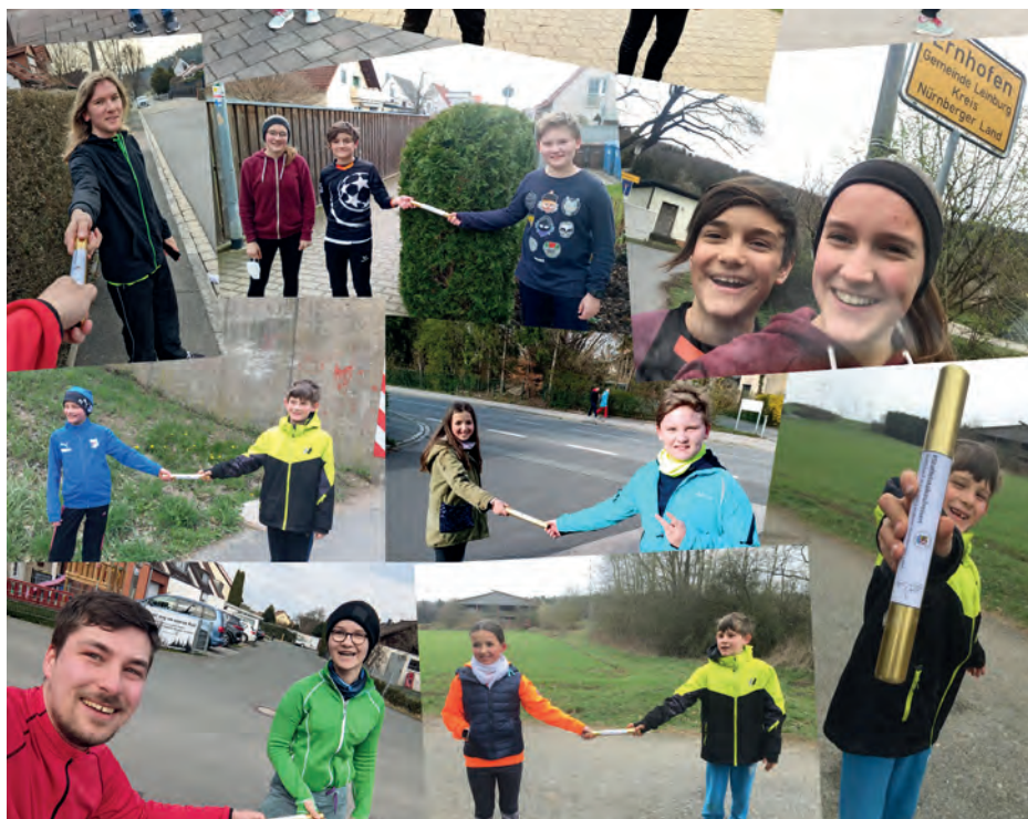
Staffelstab Übergaben der Leichtathleten