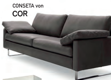
CONSETA von COR