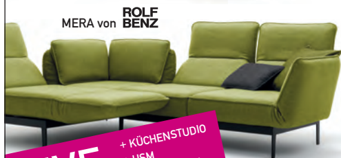
MERA von ROLF BENZ