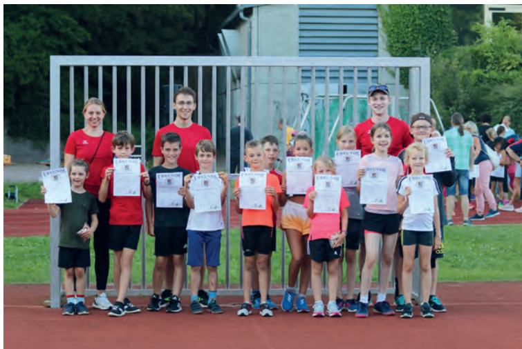
Unsere Sportler/innen mit den Trainern bei den Kreisbestenkämpfen in Lauf