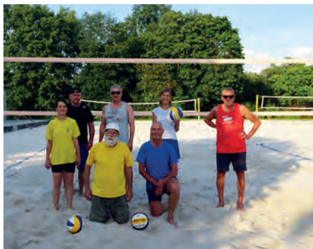
Die eifrigsten Beachvolleyballer im Jahr 2021, viermal in der Woche, auch in den Ferien: Die Seniorengruppe des TV Altdorf, mit denen auch die Wichernhäusler spielen