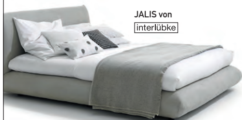
JALIS von interlücke

DAS FEINE MARKEN MÖBELHAUS FÜRTH POPPENREUTH WWW.HUELS.DE