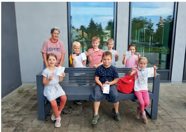
Einige der stolzen Seepferdchenkinder