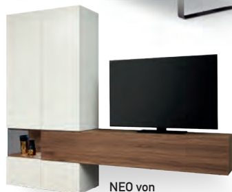
NEO von hülsta